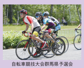
自転車競技大会群馬県予選会

定時制では、授業終了後の約1時間弱を部活動に当てています。今年も自転車競技部、陸上競技部、柔道部が主に8月に行われる全国大会に出場し、群馬県選手団の一員として全国の代表と競い合うこととなりました。仕事と学校生活の両立に日夜努力しています。