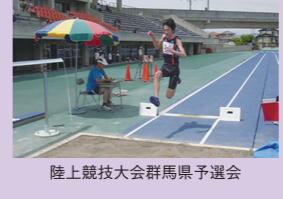
陸上競技大会群馬県予選会