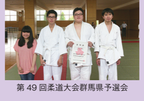
第49回柔道大会群馬県予選会