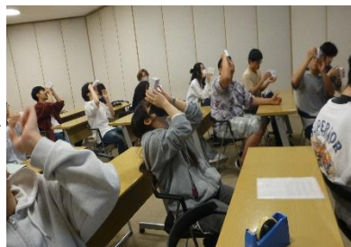
簡易分光器を使って虹を見る

6月11日(水)に校外学習の一環として、キーテクノロジーぐんま天文台(高山村)を訪問しました。3D グラスをかけ銀河を旅行したり、簡易分光器を作成し、虹を見たりしました。望遠鏡での天体観測は、あいにくの曇り空で多くは見えませんでした。火星、こと座のベガ、うしかい座のアルクトゥルスなどの星々を、短時間ではありましたが観察することができました。生徒達は、星を見つけると、歓声を上げていました。