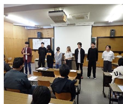
前期生徒会 役員自己紹介