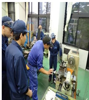
教員による説明を聞く生徒

性格なので、なかなか上手いきませんが、色々と考えながら取り組むことは楽しいので、少しでも上達するように頑張りたいと思います。」と意気込んでいました。今後の生徒達の成長が楽しみです。